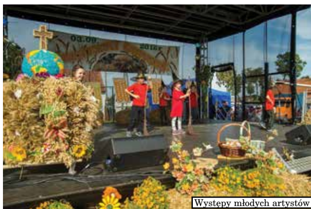
Występy młodych artystów