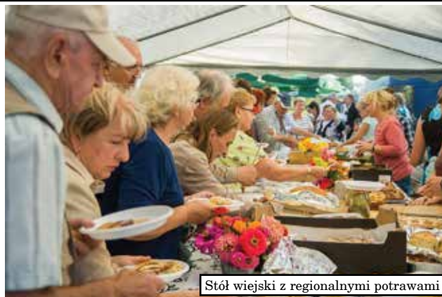
Stół wiejski z regionalnymi potrawami

momentów była degustacja potraw z wiejskiego stołu. Przygotowali go mieszkańcy sołectw: Olszewa, Żelwag, Lubiewa, Faszcz, Prawdowa, Górkła, Grabówki i Woźnic.