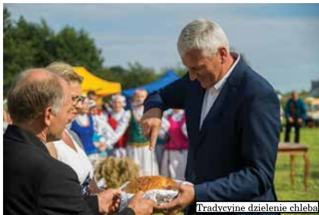
Tradycyjne dzielenie chleba

Jednym z najbardziej oczekiwanych przez wszystkich gości i mieszkańców