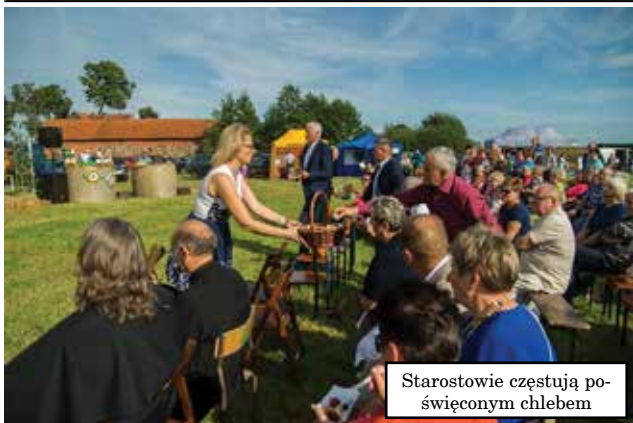
Starostowie częstują poświęconym chlebem