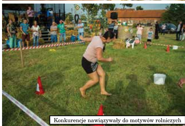
Konkurencje nawiązywały do motywów rolniczych