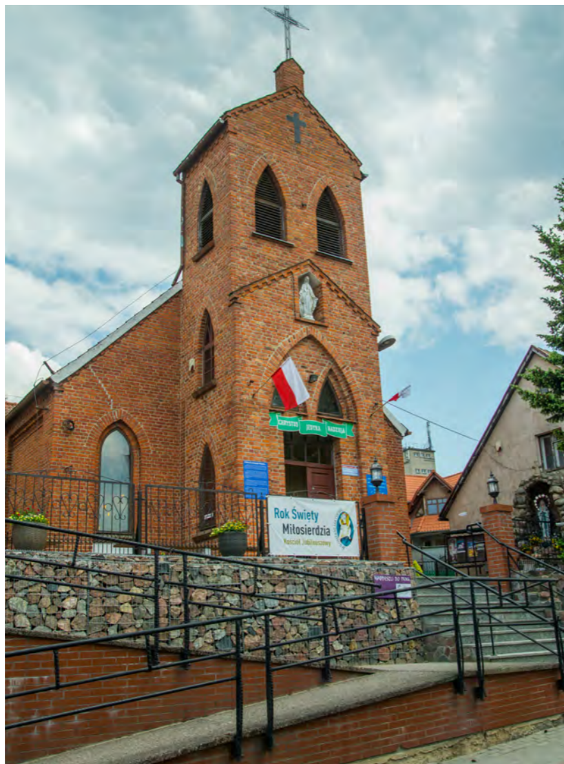
Kościół parafii pw. Matki Bożej Różańcowej był pierwotnie ewangelickim domem ludowym, połączony z budynkiem mieszkalnym, który wybudowano w 1910 r.

Punkt widokowy otwarty jest 6 dni w tygodniu, poza poniedziałkiem, w godzinach 10.00-13.00.