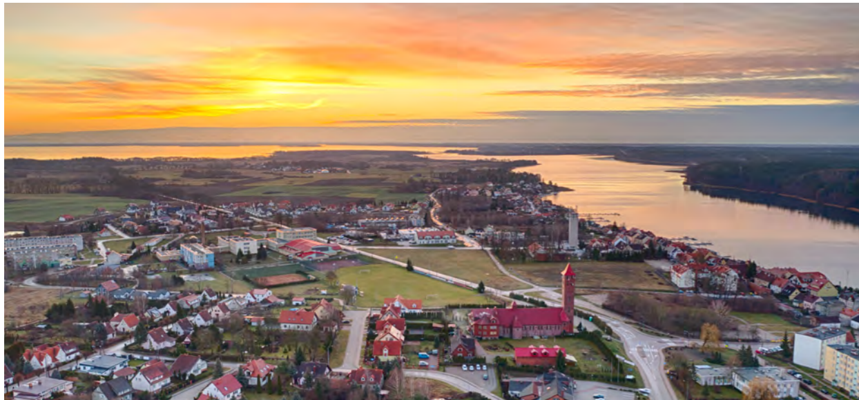
Stojąca na wzgórzu czerwona wieża kościoła pw. św. Mikołaja góruje nad miastem.

góruje nad miastem. To idealne miejsce do obserwacji panoramy okolicznych jezior oraz mazurskiej architektury, której charakterystycznym elementem jest czerwona dachówka.