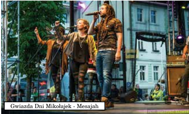
Gwiazda Dni Mikołajek - Mesajah

Tegoroczne Dni Mikołajek przez trzy dni dostarczały emocje muzycznych oraz spektakularnych widowisk na wodzie. Wszystko w ramach 290-lecia obchodów nadania praw miejskich Mikołajkom.