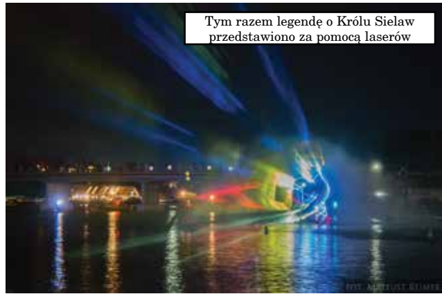
Tym razem legendę o Królu Sielaw przedstawiono za pomocą laserów