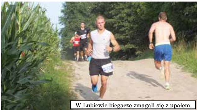
W Lubiewie biegacze zmagali się z upałem