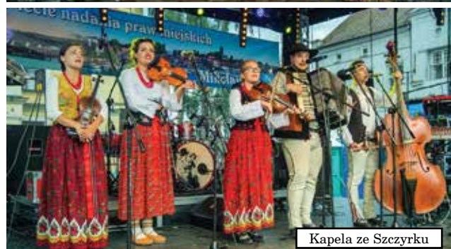
Kapela ze Szczyrku