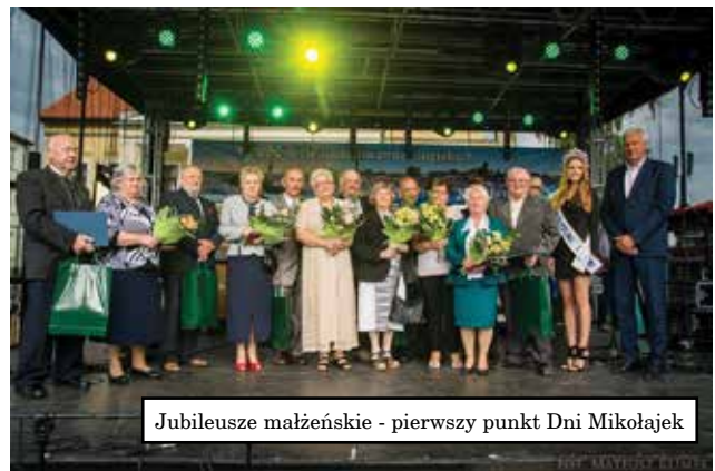
Jubileusze małżeńskie - pierwszy punkt Dni Mikołajek

tym roku zaproponowaliśmy - czyli warsztaty kulinarne dla wszystkich za miast konkursów dla ku-