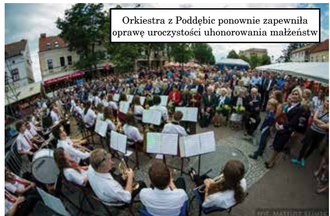
Orkiestra z Poddębic ponownie zapewniła oprawę uroczystości uhonorowania małżeństw