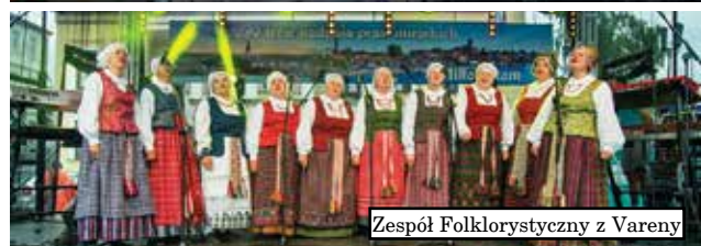
Zespół Folklorystyczny z Vareny