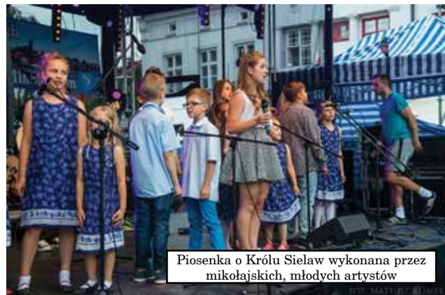
Piosenka o Królu Sielaw wykonana przez mikołajskich, młodych artystów