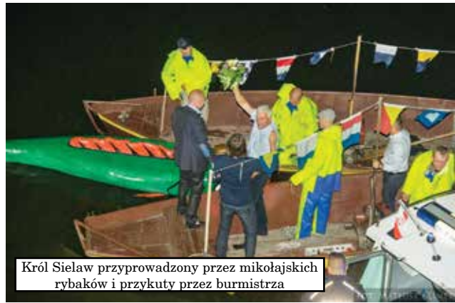
Król Sielaw przyprowadzony przez mikołajskich rybaków i przykutą przez burmistrza